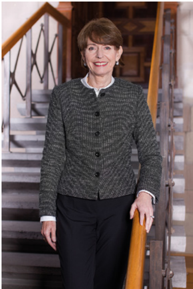
Henriette Reker, Oberbürgermeisterin der Stadt Köln