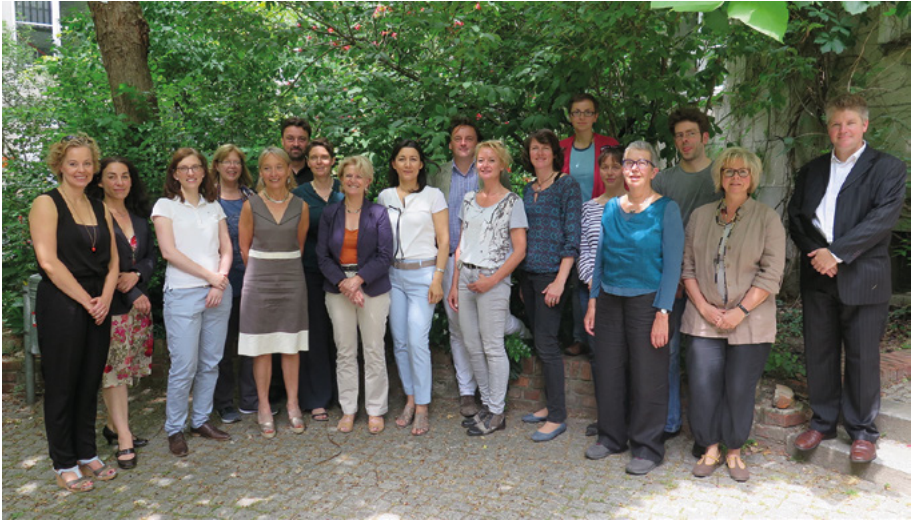
Teilnehmer_innen des zweiten Netzwerktreffens in Berlin; Copyright privat.

Umso mehr freue ich mich, dass es mit diesem Netzwerk möglich ist, diejenigen, die in Verwaltungen auf Kommunal- und Landesebene zum Thema Diversity arbeiten, zusammenzubringen und so den Austausch zu fördern.